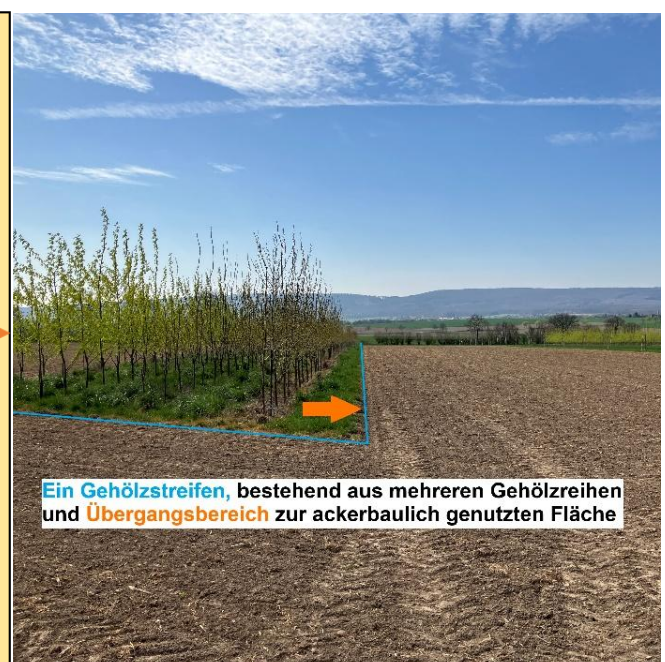
Abbildung 1: Darstellung Gehölzstreifen und Übergangsbereich